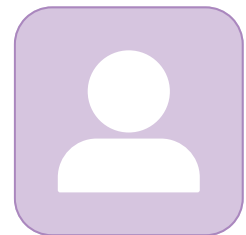
- ตำแหน่งว่าง - วิศวกรปฏิบัติการชำนาญการ โทร. -