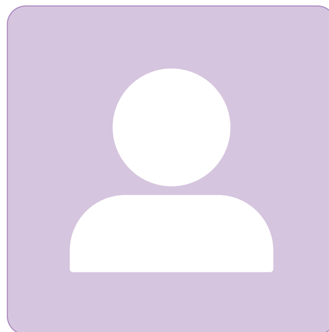
- ตำแหน่งว่าง - วิศวกรปฏิบัติการ/ชำนาญการ โทร. -